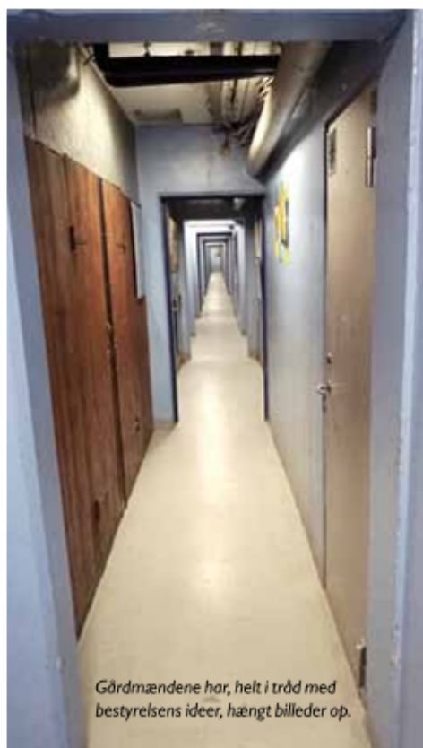
Gårdmændene har, helt i tråd med bestyrelsens ideer, hængt billeder op.

Den nye helhedsplan er nu rullet i gang med start 1. januar 2017. Rigtig mange ting er sat i søen, og flere kommer til, læs mere andet sted i bladet.