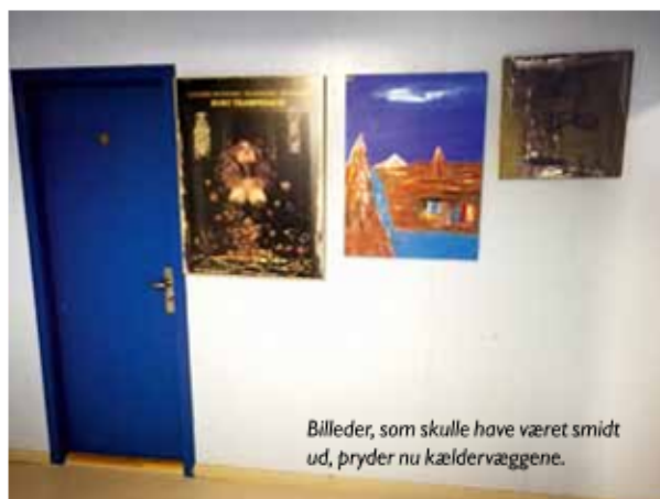
Billeder, som skulle have været smidt ud, pryder nu kældervæggene.

interessen var jo meget, meget større. Dejligt "at røre i en gryde", der har så stor interesse.