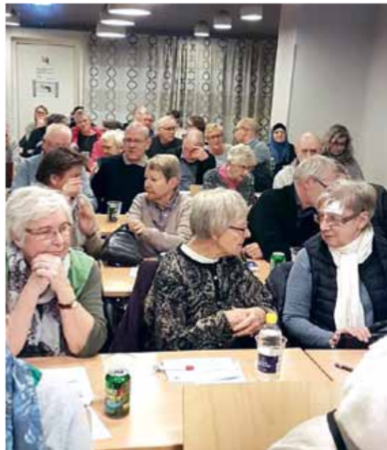
Onsdag den 8. marts var der ekstraordinært afdelingsmøde.