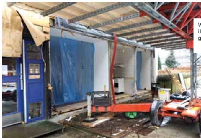
Vinduesudskiftning i Firkantens ind- gangspartier