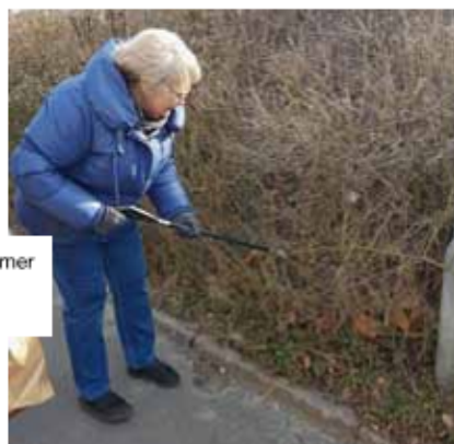
Efter nogle timer så det rigtig pænt ud