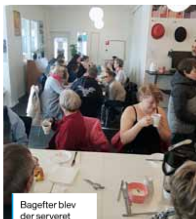
Bagefter blev der serveret suppe i Pulsen