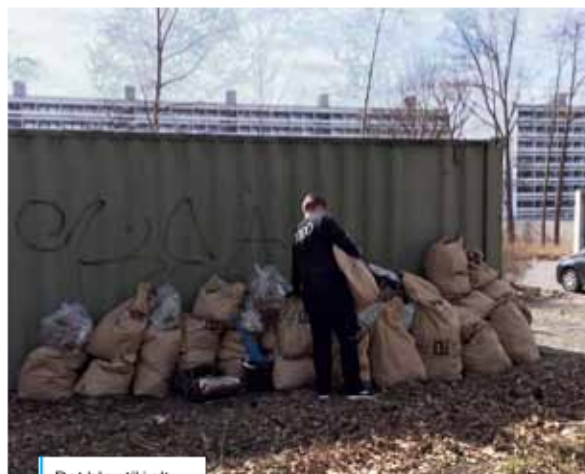
Det blev til i alt 65 fyldte sække