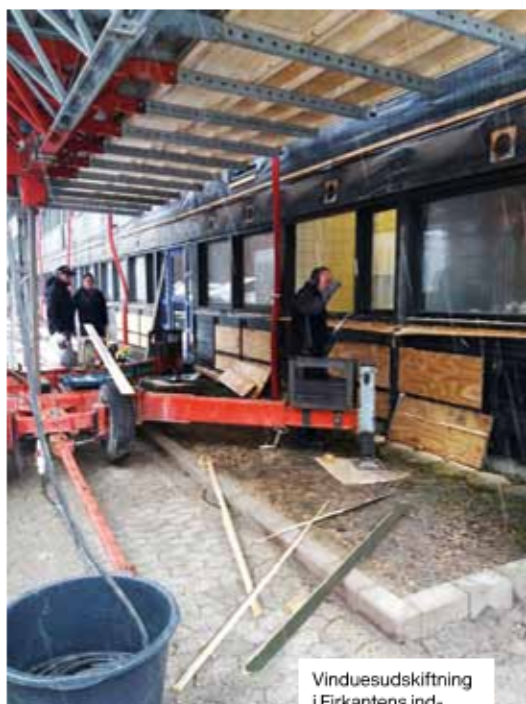
Vinduesudskiftning i Firkantens ind- gangspartier

Så er vi endelig kommet i gang med vinduesudskiftningen i Firkantens indgangspartier, og det ser ud til, at alt forløber fint.