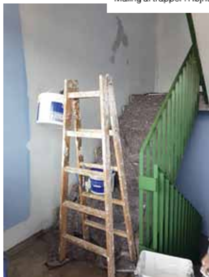
Maling af trapper i Højhuset